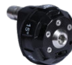
Boquilla 6 en 1