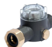
Filtro 80 mic