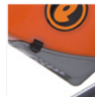
Tapa de inspección