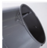
Aro boca de tambor