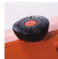
Perilla tensor de correa