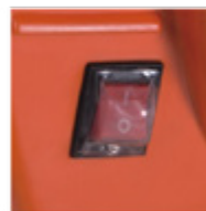
Interruptor con doble aislación